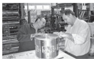
Minden vállalkozás számára fontos az információk

A rendezvény egyik apropóját a szolgáltatta, hogy