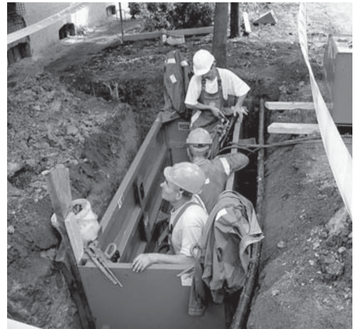
Csőbehúzás egy korábban kiépített hálózatban: a szennyvízrendszer megkönnyíti a lakosság életét és a környezetet is óvja

Lényeges eredménye az előkészítő munkának, hogy a pénzügyi kérdések is rendeződtek, a tervek szerint a várható költségek fedezete, mintegy 2,997 milliárd forint