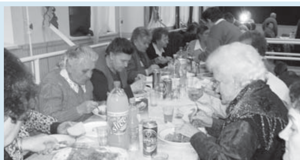
A vacsora nagyon ízletes volt